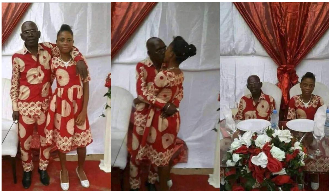
Figura 7. Representação de casamento prematuro.

Segundo dados da Unicef 2015, Moçambique é um dos países a nível mundial com as taxas mais elevadas de casamentos prematuros, ocupando 11º lugar, em que 14% das mulheres, entre os 20 e 24 anos de idade, casaram antes dos 15 anos de idade, e 48% casaram antes dos 18 anos de idade.