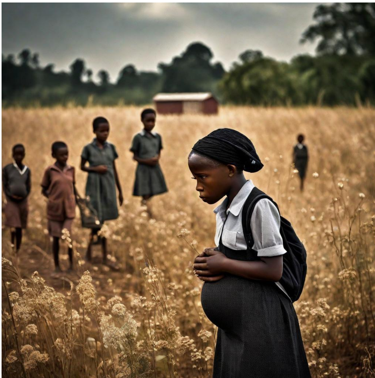
Figura 4. Menor grávida a caminho da escola. (Imagem gerada por IA Bluewillow).

A imagem acima ilustra a consequência do ato que foi perpetuado na imagem 3 que culminou na gravidez da menor.