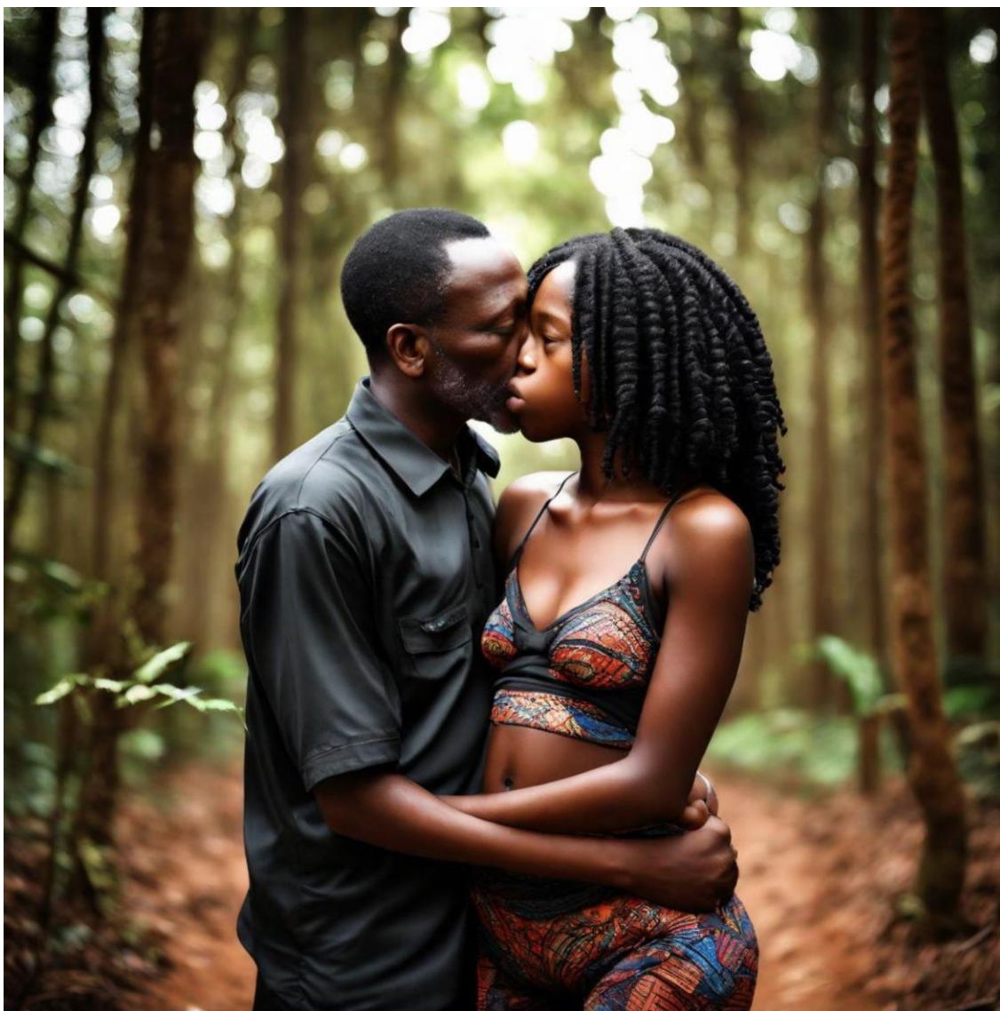
Figura 2. O desvio de um sonho. (Imagem gerada por IA Bluewillow)

A imagem acima ilustra um senhor de idade trocando carícias com uma menina menor de idade no meio da mata.