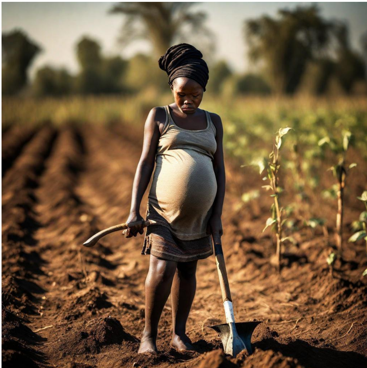
Figura 5. O fim de um sonho. (Imagem gerada por IA BlueWillow).

A imagem acima ilustra o fim de um sonho que vinha sendo construído na imagem 1, que foi interrompido pela acção perpetuada nas imagens 2 e 3.