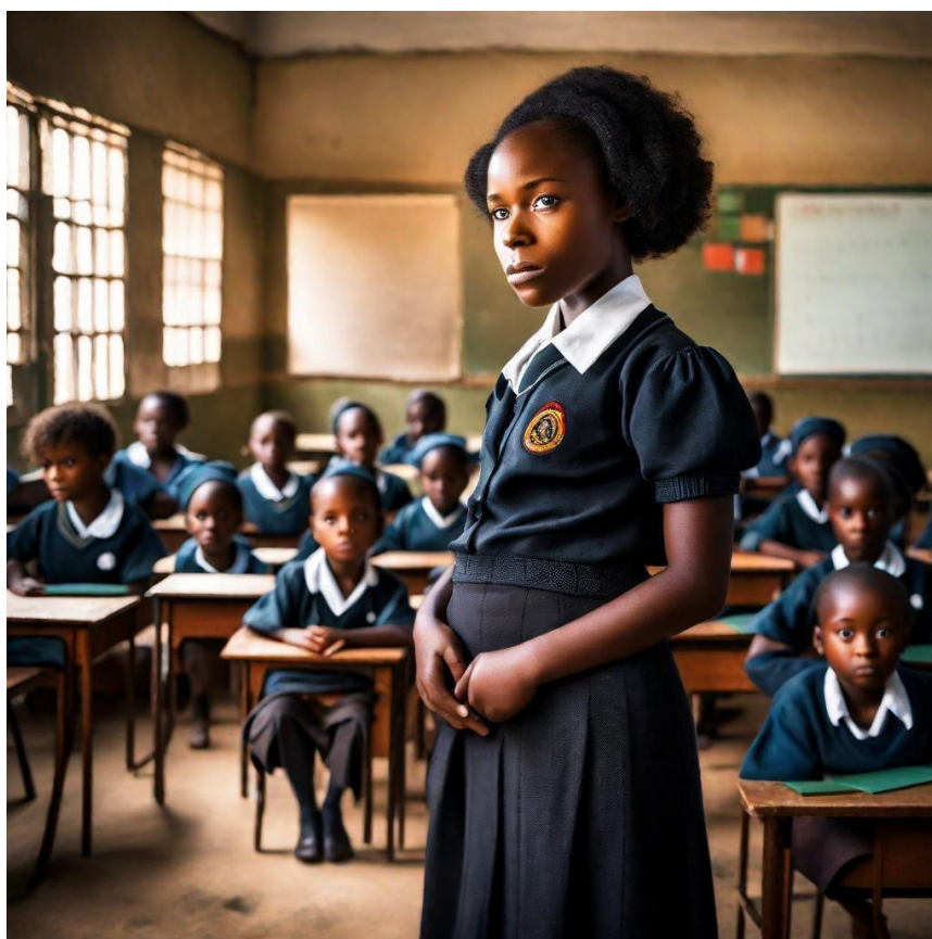
Figura 1. O percurso estudantil. (Imagem gerada por IA BlueWillow).

A escola é lugar onde os jovens criam os seus sonhos e lutam em busca de um futuro melhor e promissor.