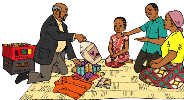
Fig1. Autor desconhecido. (Fonte Google imagem)

5. Observe a imagem acima e faça a sua interpretação sobre a mesma.