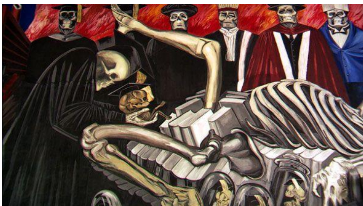
Imagem 9. Mural de Rozco, Cidade de México.

O muralismo que actualmente encontramos nas cidades resulta de diferentes tradições e movimentos, apesar de muitas vezes ser associado ao graffiti norte-americano, nomeadamente pelas técnicas e utensílios empregados (Ricardo Campos e Silvia Camara,2019 p.78). Todas estas formas mencionadas acima, fazem partes das diferentes manifestações que podem ser encontradas e que os artistas usam na valorização e revitalização dos locais públicos nas cidades.