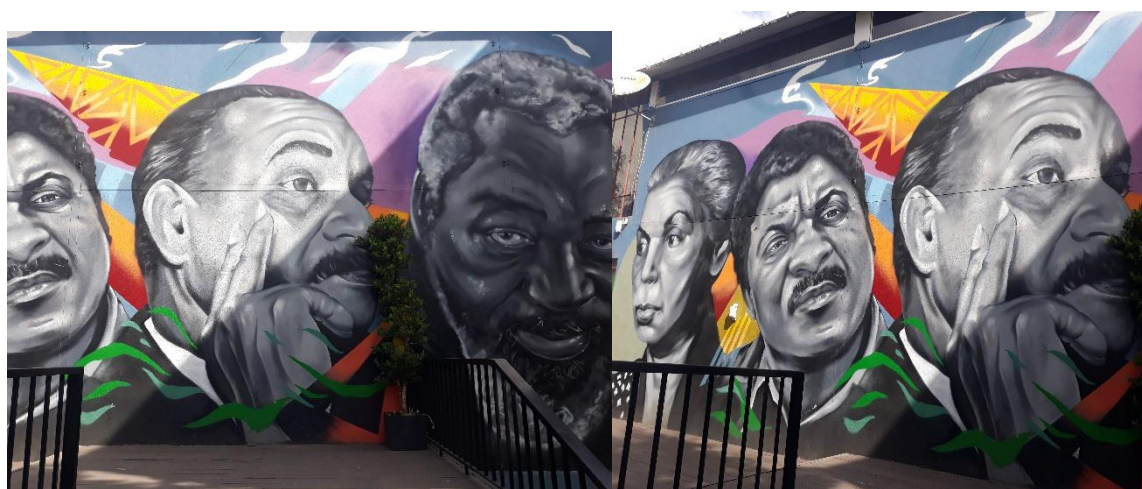
Imagem 10. Mural da galeria do porto de Maputo, mural em estudo

Durante as entrevistas, as respostas foram registadas num gravador e por fim transcritas para o papel, sendo fiel a todos posicionamentos revelados.