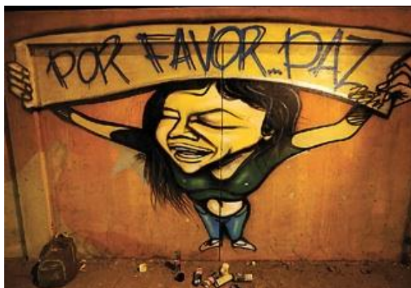
Imagem 8. Graffiti, Maputo-Shot B

DICKINSON (2014.p39) aponta as origens dos graffiti ocidental na pólis grega, destacando ainda a sua presença em cidades romanas. Ficaram-nos exemplos de graffiti populares inscritos em Pompeia ou Roma, com mensagens do quotidiano e dizeres de natureza política, humorística ou erótica. O grafite é definido por REIFSCHNEIDER (2015 p.34) pelo espaço físico em que ele ocupa e por sua efemeridade de duração, uma vez que ele faz tanto o uso de signos plásticos como as cores, formas e texturas quanto dos signos linguísticos e icônicos.