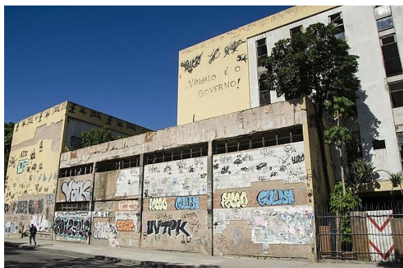
Imagem 7. Pichação de um prédio residencial, Rio de Janeiro