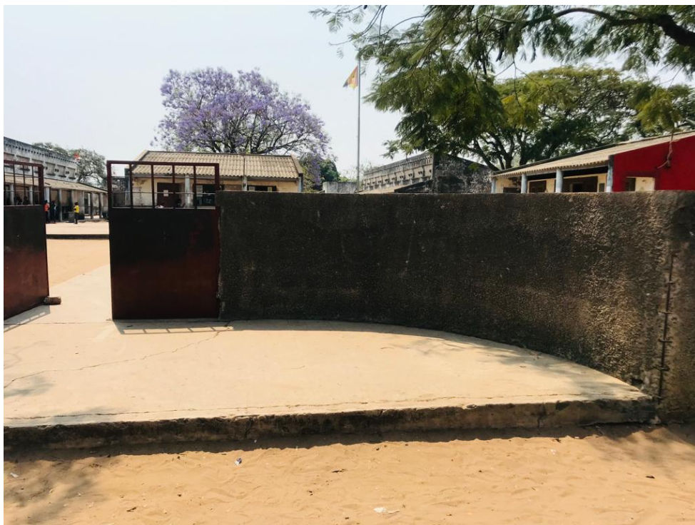
Imagem 12. Muro escolhido para a Intervenção artística.

Após esse processo, procedeu-se com a pintura do muro, aplicando uma obra de arte como ilustram as imagens abaixo: