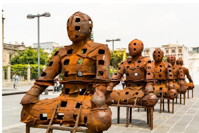
Imagem 1. Esculturas de ferro, cidade de México