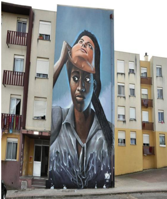
Imagem 4. Shifter.pt, Vogue