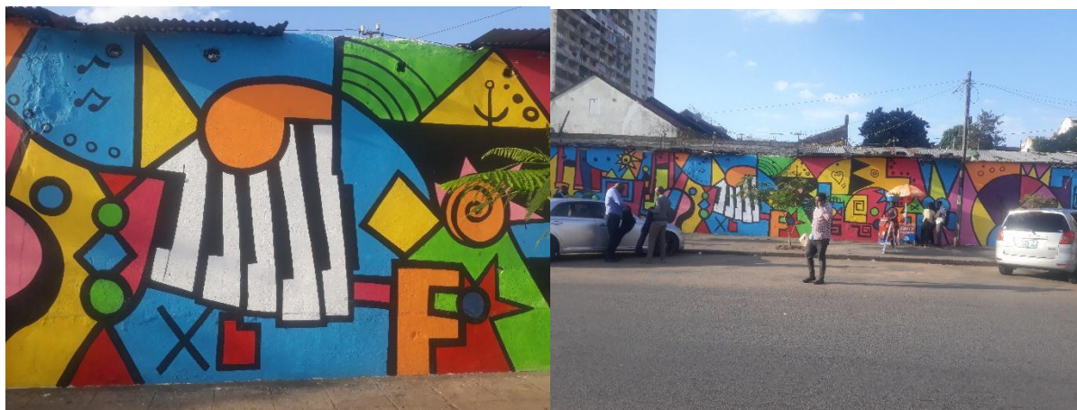
Imagem 11. Mural do Mercado do povo, mural em estudo.

Questão um: Como caracterizaria o aspecto do muro do mercado antes da intervenção artística?