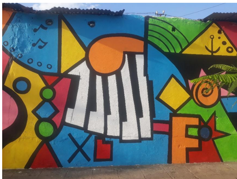
Imagem 6. Mercado do Povo.