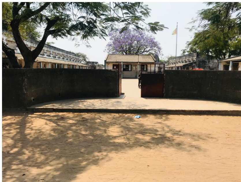
Imagem 12. Muro escolhido para a Intervenção artística.

Após aprovado o pedido de desenvolvimento do trabalho de campo na Escola, identificou-se o local apropriado para a intervenção artística, em que foi o muro que dá entrada para a Escola, como ilustram as imagens.