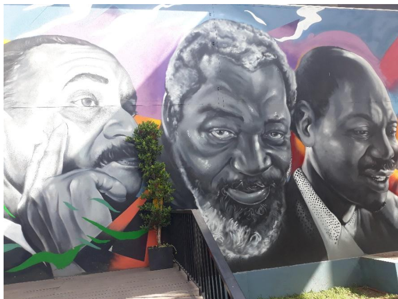
Imagem 5. Galeria porto de Maputo, ShotB