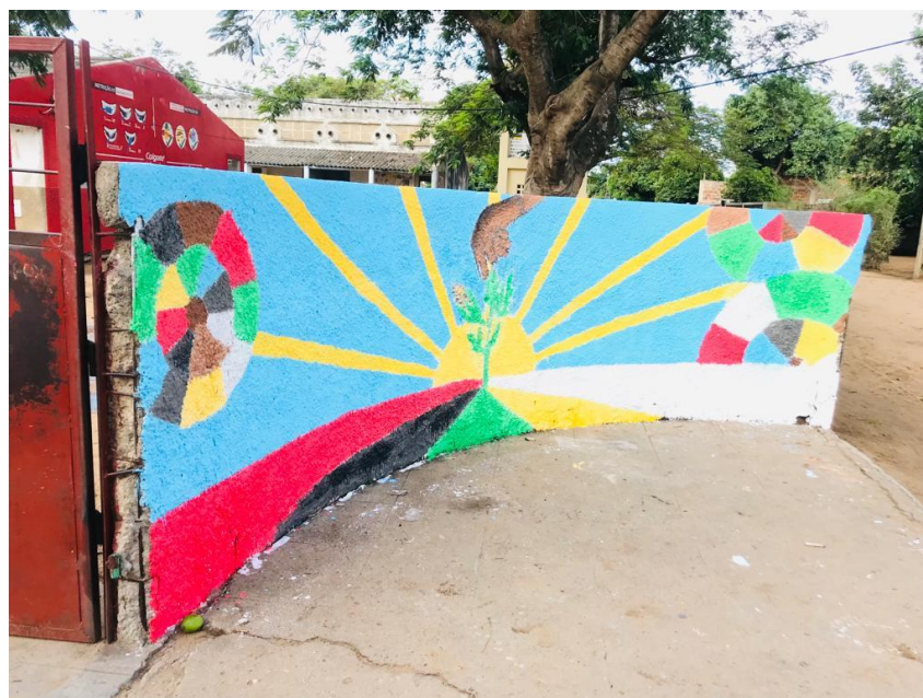
Imagem 13. Muro depois da pintura

Após esse processo, procedeu-se com a pintura do muro, aplicando uma obra de arte como ilustram as imagens abaixo: