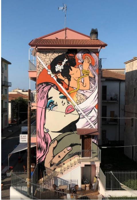
Imagem 3. Graffiti, Italia