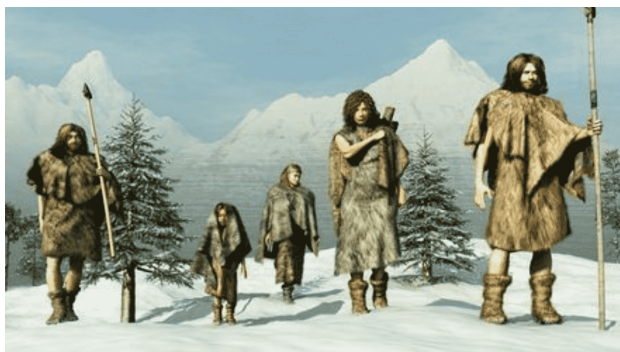
Fig: 1 Homens vestidos de peles de animais.

A história da moda tem sua origem muito antes do Renascimento, por volta de 600 mil anos a.C. com o surgimento da roupa. Ela vem acompanhando, o surgimento da roupa, está diretamente ligado à necessidade do ser humano de esconder a nudez e também, de se proteger do frio, chuva ou calor.