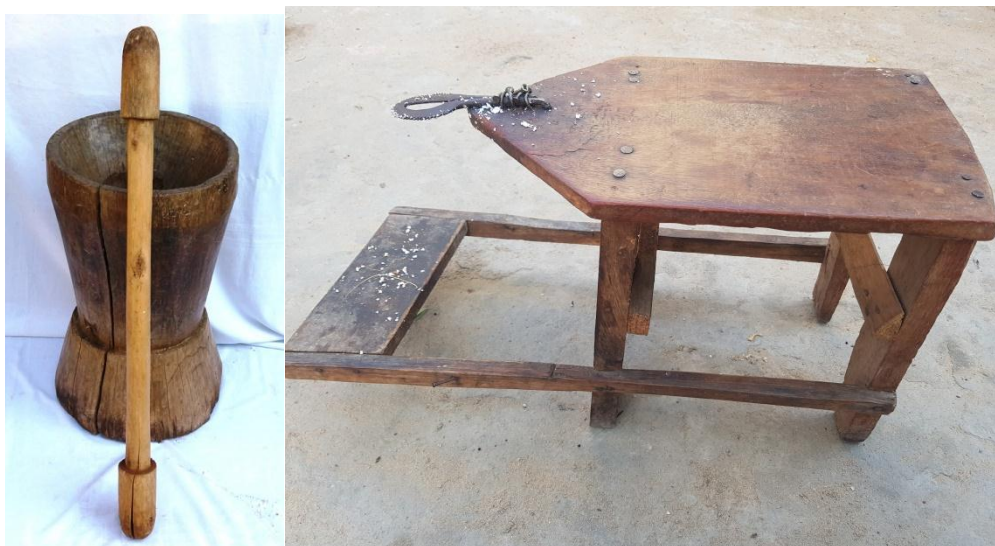
Fig: 7 Objectos utilitários

famílias. A cerâmica tradicional ou de uso comum no nosso país é uma actividade para o fabrico de recipientes cujas principais funções são do transporte e recipientes de água e para conservação, confecção de alimentos e fins decorativos.