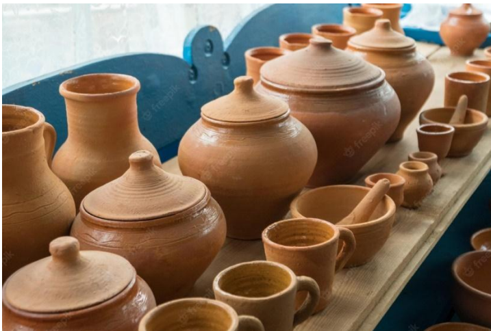
Fig: 6 Objectos da cerâmica

A imagem da figura acima representa uma forma de expressão artística que consiste na manipulação da matéria com intenção de criar formas tridimensionais. Toda peça escultórica supõe um volume no espaço, que tem valor tanto em si mesmo como em sua relação com o entorno. A escultura define certa silhueta e era determinada massa, que pode sugerir tanto peso e solidez como fluidez e leveza. Muitos dos objectos aqui representados podem ser usados como acessórios da moda.