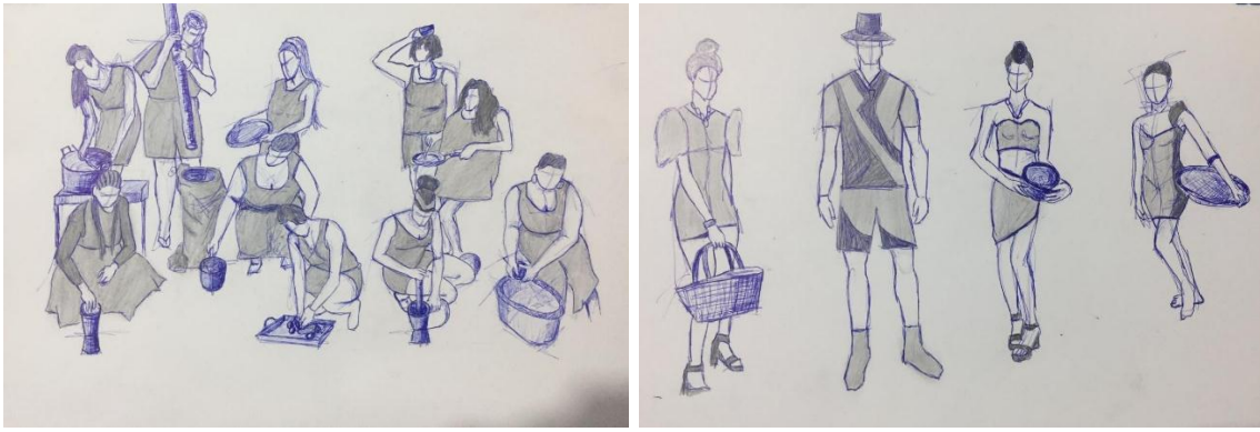
Fig: 8 A moda e a cultura 1 e 2 (esboços e croquis)