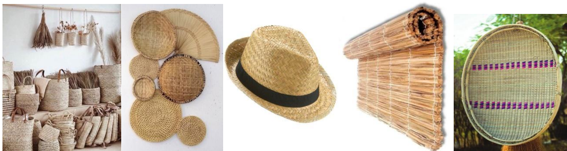
Fig: 3 Cestaria

Artefactos culturais produzidos na Província de Maputo.