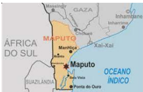
Fig: 2 Mapa de cidade de Maputo.

A Província de Maputo limita-se a norte com a Província de Gaza, a leste com o Oceano Índico e com a Cidade de Maputo. A sul, faz fronteira com a Província Sul-Africana do KwaZulu-Natal e a oeste com a Suazilândia e com a Província de Mpumalanga da África do Sul. E conta com uma densidade populacional de 2 507 098 habitantes segundo censo populacional realizado em 2017, sendo 600 mil composta por jovens dos 15 a 35 anos.