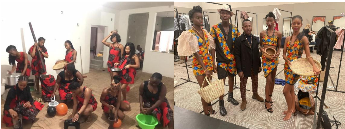
Fig: 9 A moda e a cultura 1 e 2 (coleções)

Nessa fase as peças encontram-se prontas para serem apresentadas ao público, como uma nova tendência da moda moçambicana concretamente da província de maputo, de transmitir a mensagem de que não precisamos ignorar a modernidade mas temos que preservar a nossa cultura, preservar a nossa identidade e acima de tudo termos o orgulho dela. Pode-se observar os artefatos culturais em alguns objectos domésticos tais como pilão, pilador, ralador, peneira, cesto, etc, e em acessórios de vetuário tais como chapéu e colares.