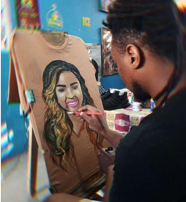
Fig: 4 Pintura

dos utilizadores fazem parte das identidades Moçambicanas. Geralmente estes objectos, trazem ensinamentos e conhecimentos sobre o passado de um povo. Revelam a mestria a criatividade dos artistas que os produzem e, também as histórias, as vivências e a vida social de uma comunidade. Apesar de ser uma arte muito antiga, a técnica da cestaria manteve-se praticamente a mesma, sendo feita à mão. O artesanato moderno usa a mesma técnica, dando adaptações criativas e com finalidades decorativas.